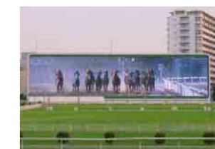
公営競技用大型映像装置 Large-scale LED display systems (Public-racetrack)