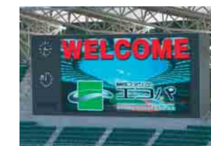
競技場フルカラーLED映像装置 Large-scale LED display systems (Sports Stadium)

Manufacture of high-precision metal molds, 3D high-precision cutting of high-hardness materials, high-precision sheet processing, high-speed aluminum materials processing, others