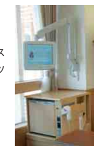
ベッドサイドシステム Bedside system

診療受付の端末、診療スケジュールの表示装置に加え、電子カルテと連携して医療スタッフを支援するメディカル機能と、病室の患者アメニティを向上させる各種コンテンツの提供機能を備えたベッドサイド端末を開発し、医療システムを構築しました。