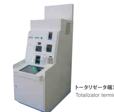
トータリゼータ端末 Totalizator terminal