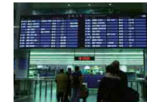
空港表示システム Flight information systems

精密金型の製造、及び高硬度材の三次元精密切削加工、薄板材の高精度加工、アルミ材の高速加工など